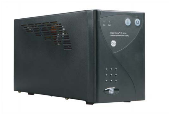
ИБП серии ML