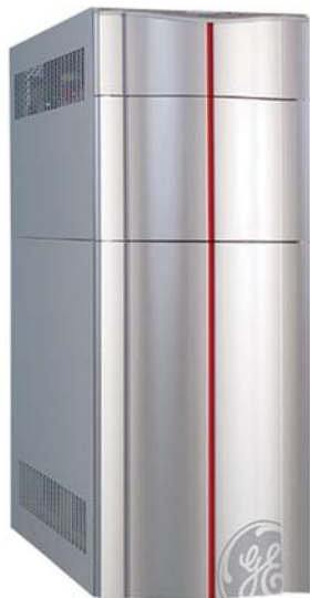
LP20-31, 20 кВА