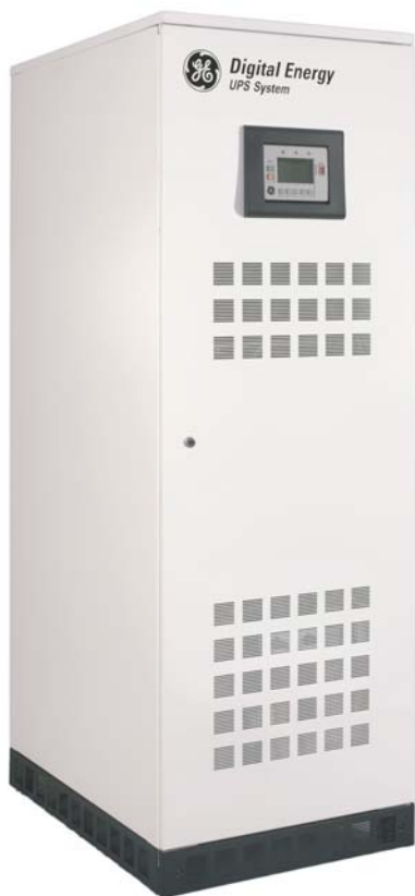
SG, 80 кВА

В течение всего срока службы все ИБП компании GE поддерживаются сервисными центрами, которые обеспечивают первоклассный, круглосуточный ремонт и настройку оборудования, обучение специалистов и консультации экспертов.