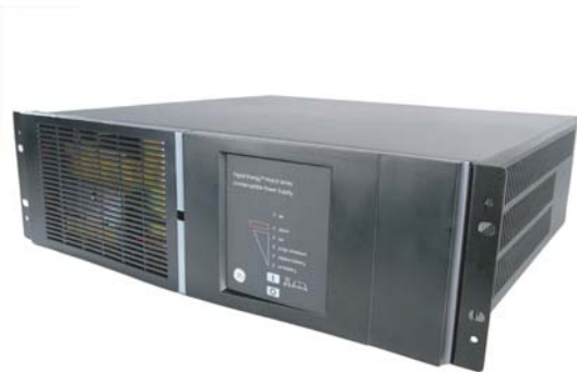
Match 19", 3000 ВА