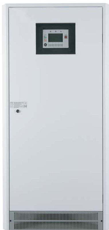
SitePro, 40 кВА

ИБП SitePro могут иметь мощность от 10 до 40 кВА. Для повышения мощности и надежности могут быть установлены в параллель до восьми ИБП. Система управляется по принципу равноправных устройств на основе разработанной GE уникальной технологии RPA™ (Redundant Parallel Architecture™ — Резервируемой Параллельной Архитектуры) с резервированием всех критичных элементов и функций. Эта технология обеспечивает максимальную надежность системы для критичных приложений, исключая нерезервируемые точки отказа.