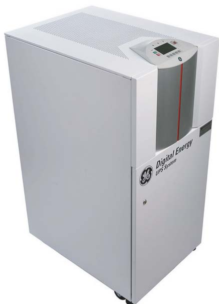
LP 33, 30 kVa

независимы), обеспечивая максимальный уровень надежности электропитания для критичных процессов. Серия LP33 разработана по методологии «Шесть Сигма», которая гарантирует полное соответствие оборудования требованиям и ожиданиям потребителя.