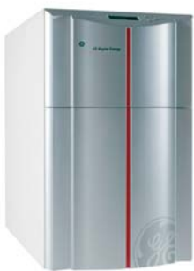
LP6-11, 6 кВА